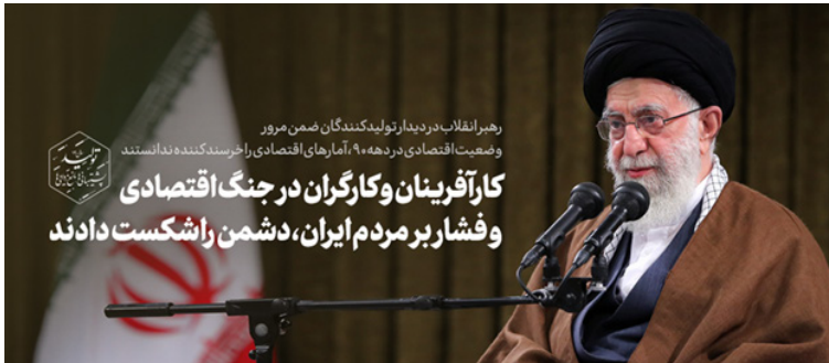
رهبر معظم انقلاب :